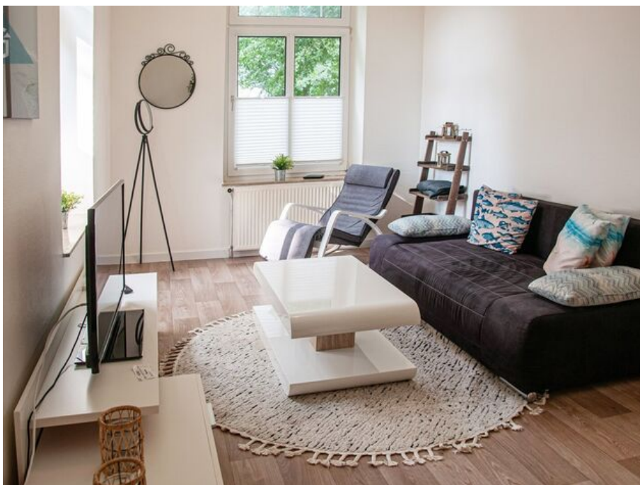
den Tag ausklingen lassen