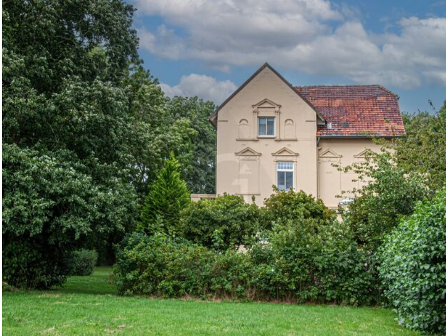
verträumter Blick - Gemeinschaftsgarten