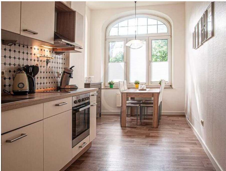
helle Küche mit Essecke