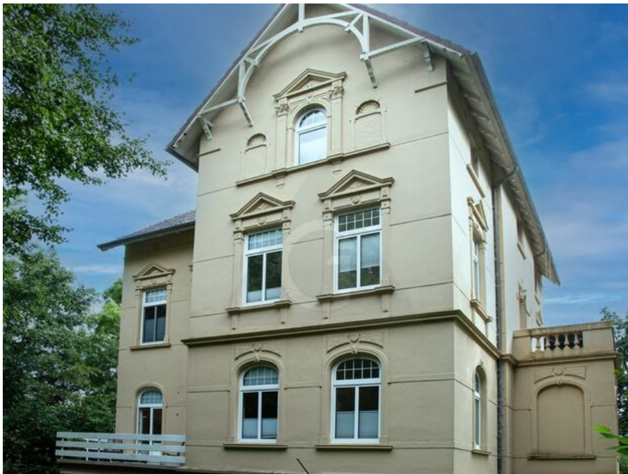
Wohnen mit Stil in der Villa Dühringshof