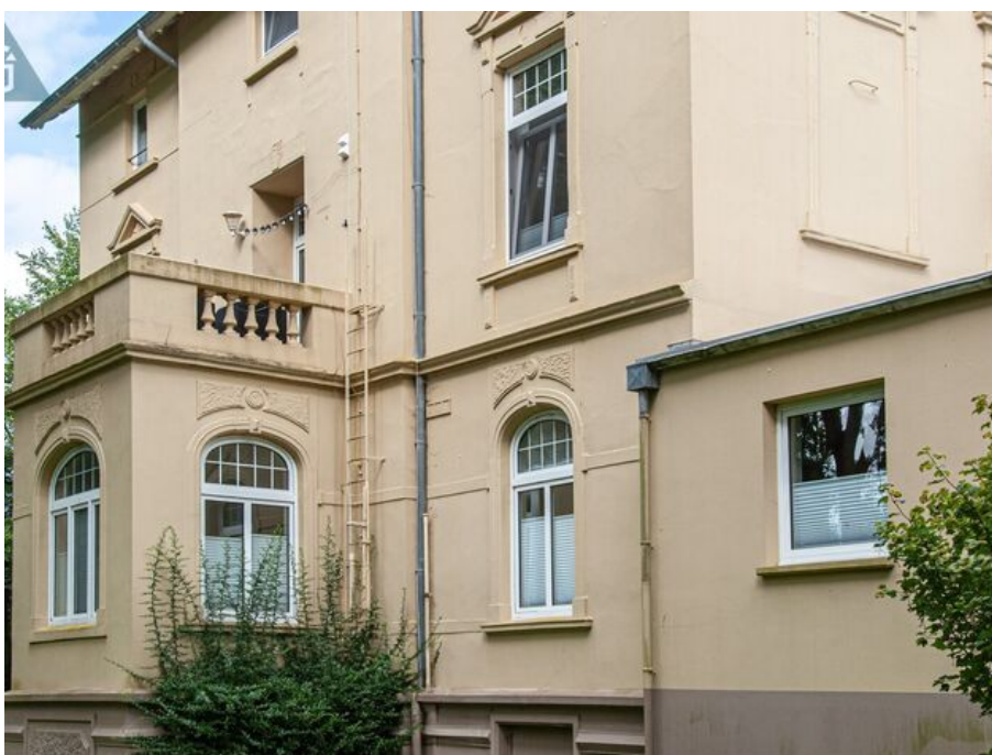
Seitenansicht der Villa