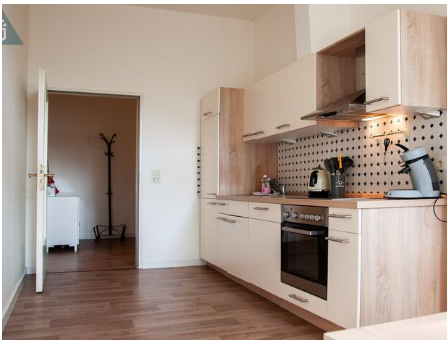
voll ausgestattete Küchenzeile