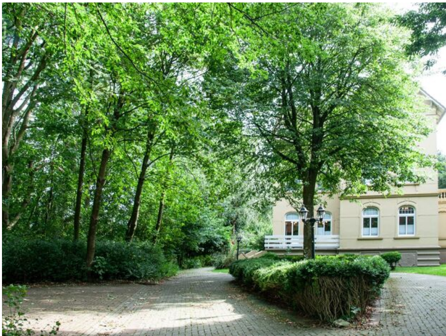
Zufahrt mit Stellplätzen für PKW